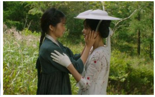
( Mademoiselle )