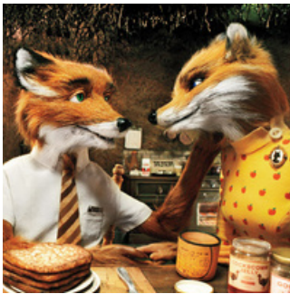
( Fantastic Mr Fox )

Peut-être que les cœurs ajoutés à cette édition, vous l'aurez deviné : spéciale Saint-Valentin , vous aurons repoussé à lire ce journal, mais je vous invite à le feuilleter tout de même (à deux ou tout.e seul.e hihi). Peu friande de ce concept, j'avoue avoir du mal à garnir cet édito au sujet de cette fête. Vous retrouverez donc dans cette édition trois super critiques sur des films contenant de belles histoires un quizz qui vous aidera à choisir votre film ainsi qu'un top 3 des meilleurs films romantiques pour toujours plus de choix, si jamais il vous venait à l'idée de rêver d'amour pour occuper votre mardi soir.