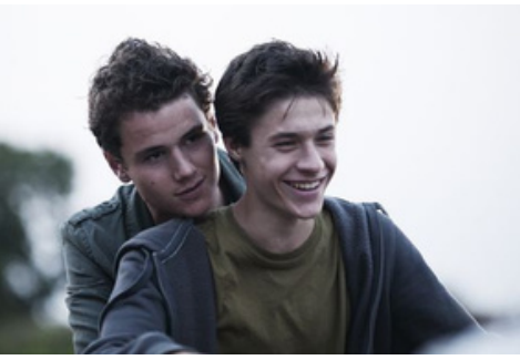
( BOYS )